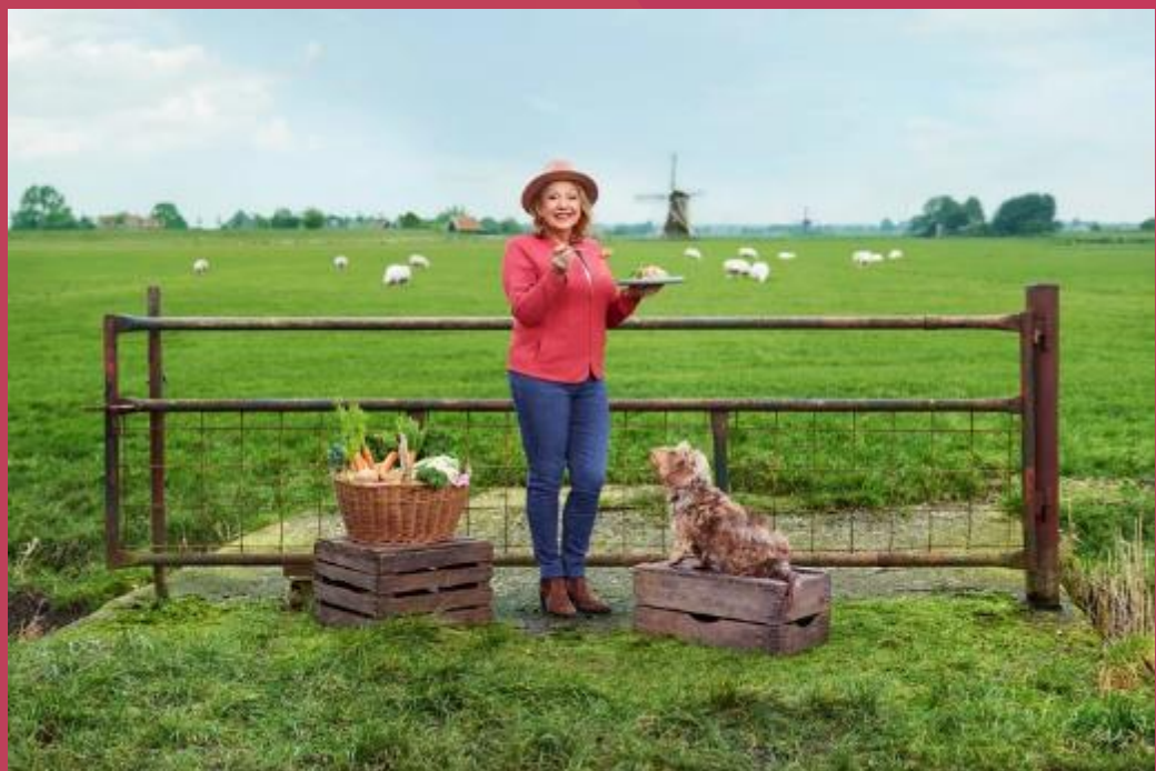
De Smaak Van Nederland