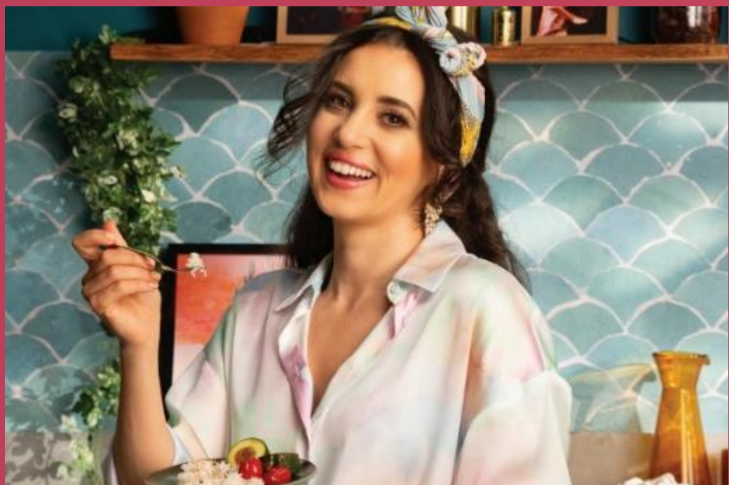
Karsu's Turkse Keuken