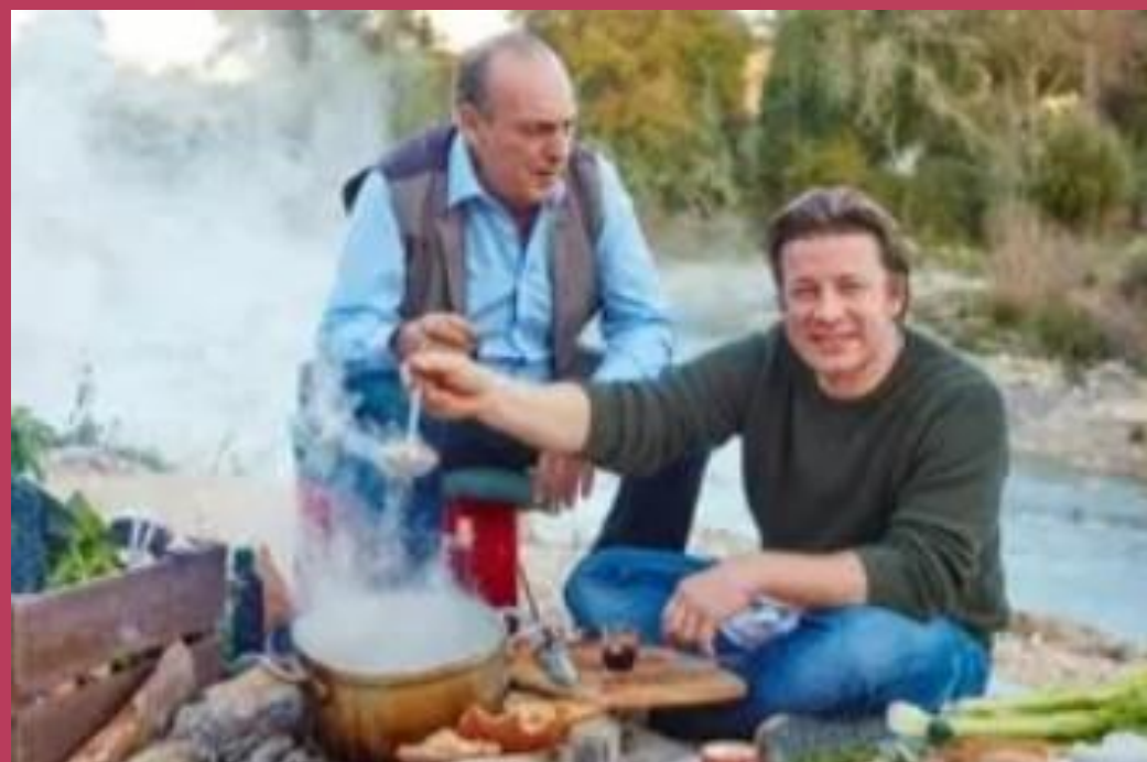
Jamie Cooks Italy