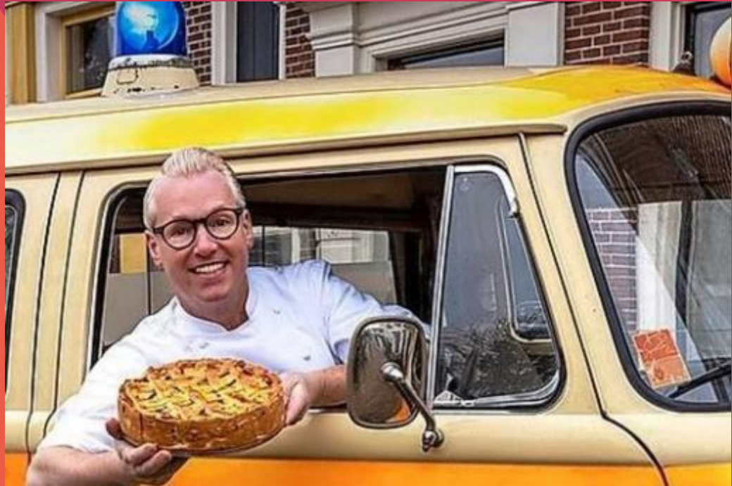
Rudolph's Eerste Hulp Bij Bak-Ongelukken