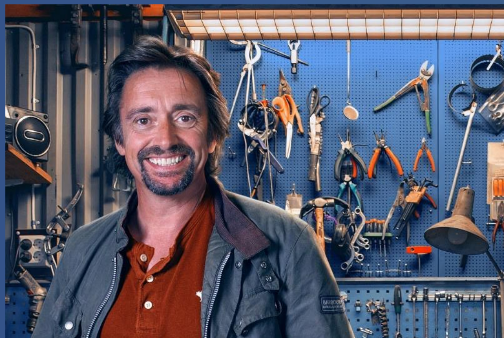
Richard Hammond's Workshop