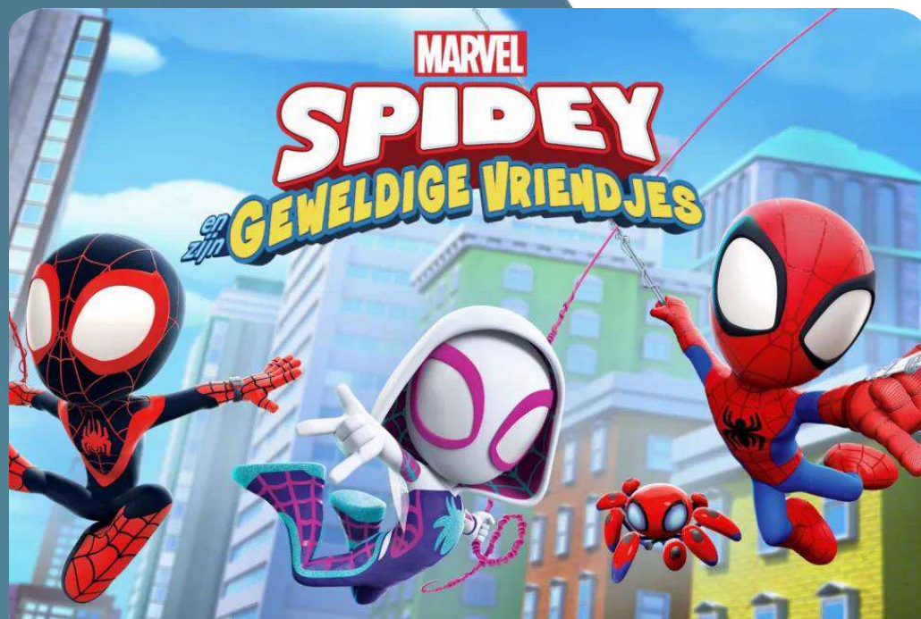
Spidey en zijn Geweldige Vriendjes