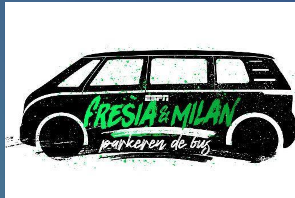
Fresia & Milan Parkeren De Bus