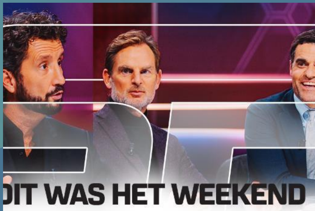
Dit Was Het Weekend