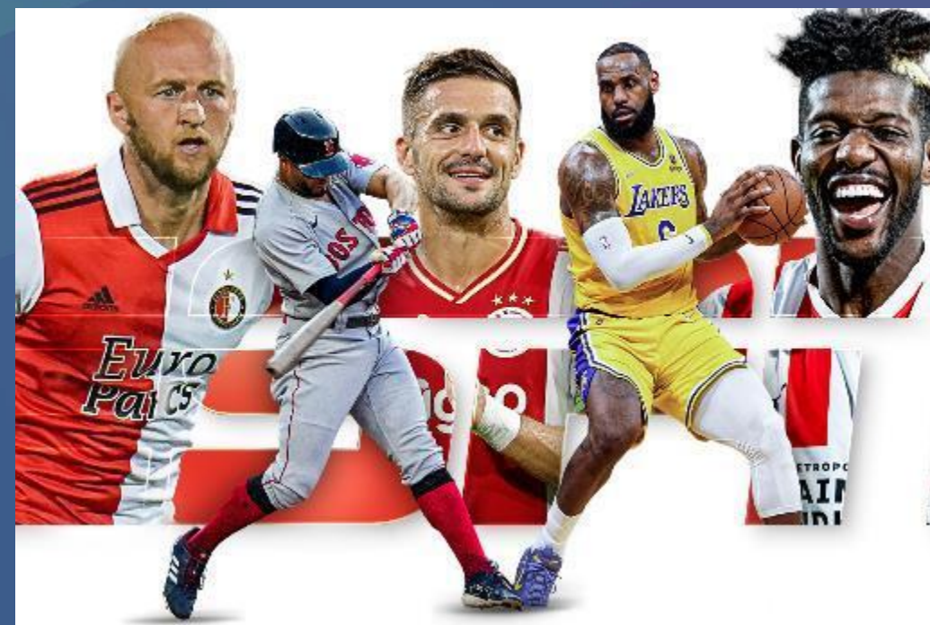
NBA, MLB, NFL & NHL