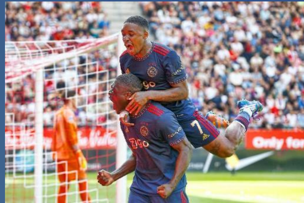
Eredivisie Voetbal Mannen & Vrouwen