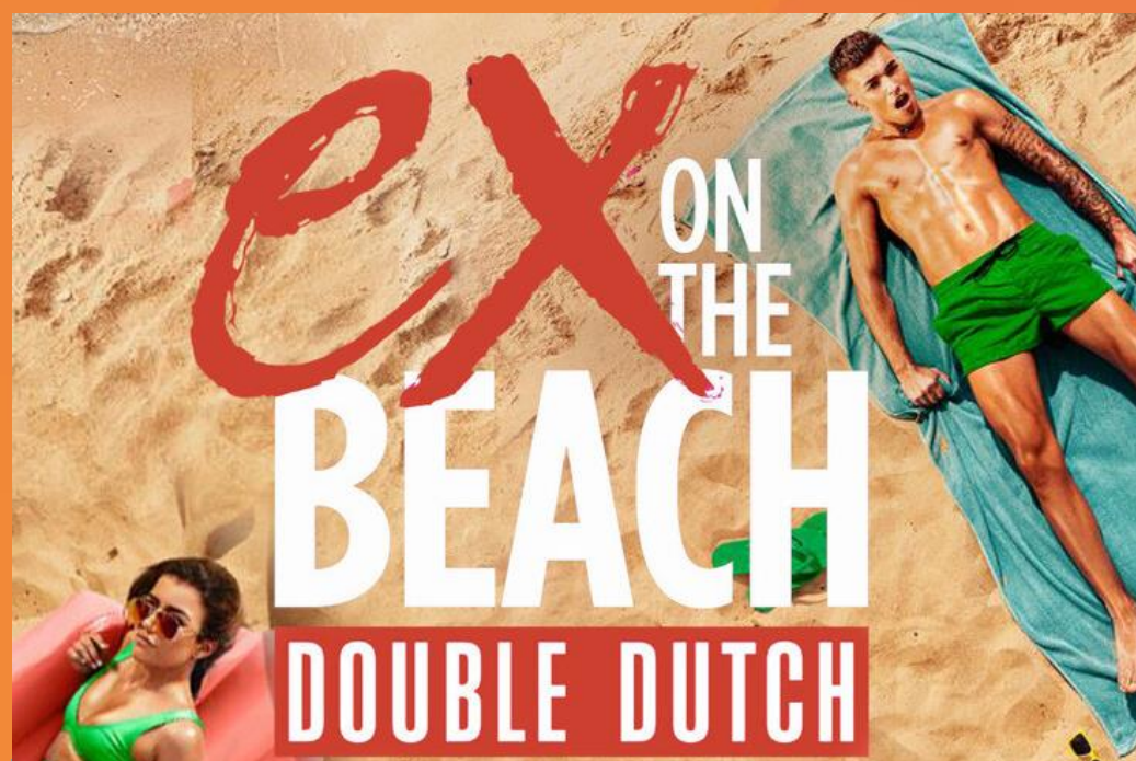
Ex On The Beach: Double Dutch