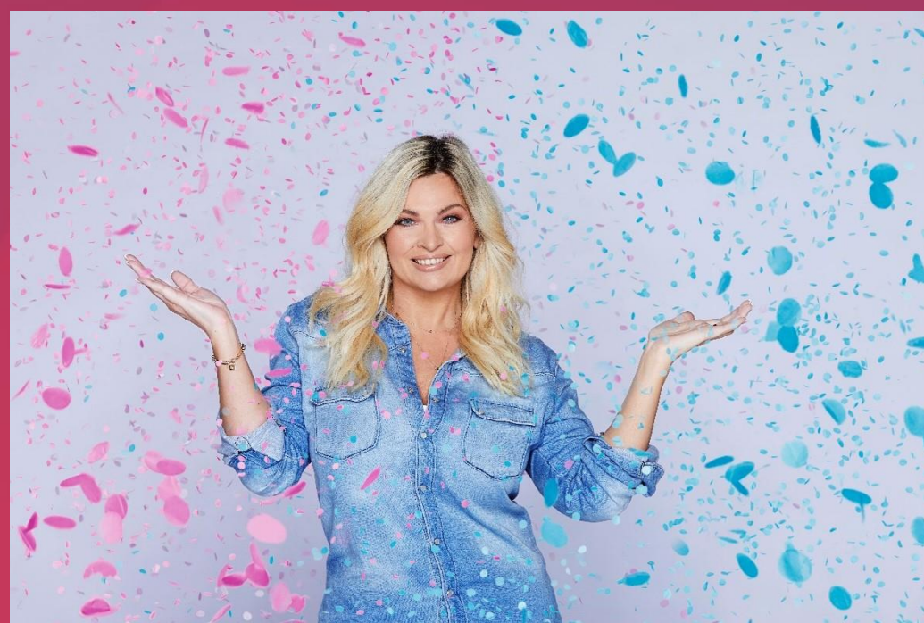
Bevallen met Bobbi