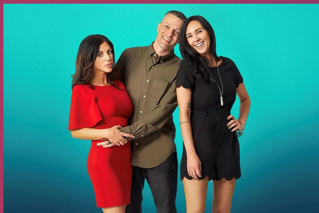
You, Me and My Ex