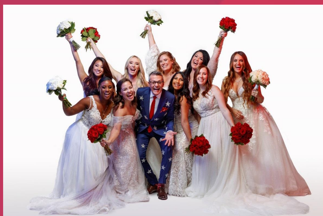
Say Yes To The Dress