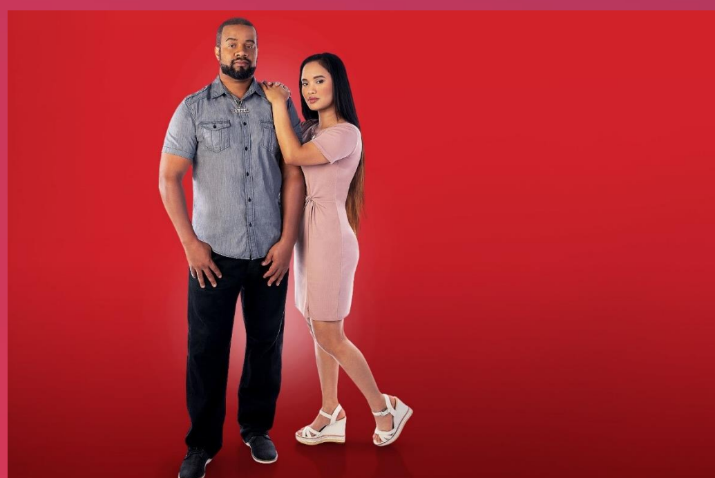
90 Day Fiancé