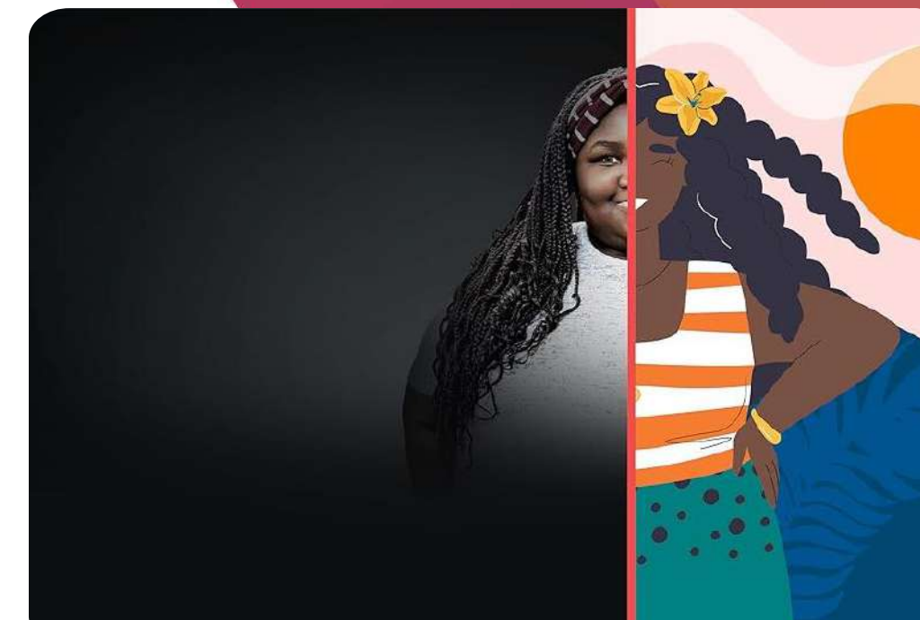
Quarter Ton Teen