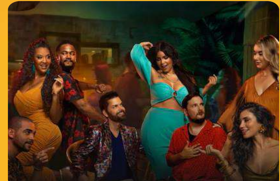
90 Day: Hunt for Love