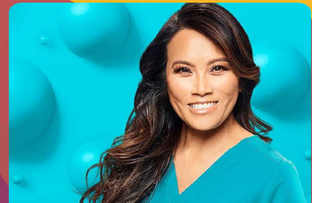
Dr. Pimple Popper

Bron: NMO, 1 januari t/m 31 december 2025, all day