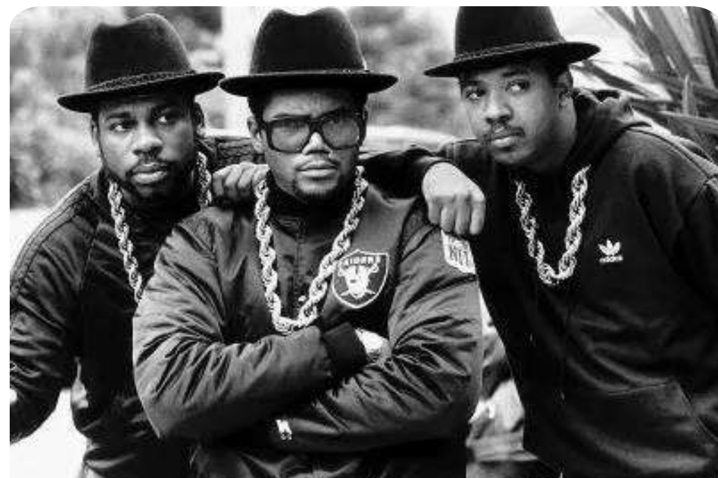
Old School Hip Hop