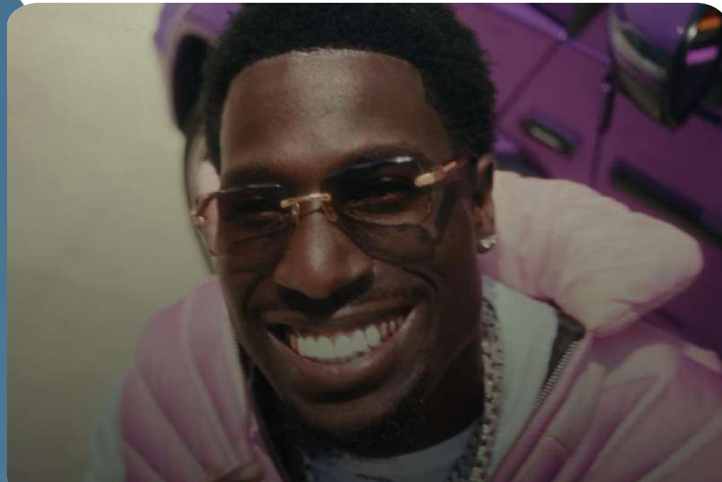
XITE Hits Top 20