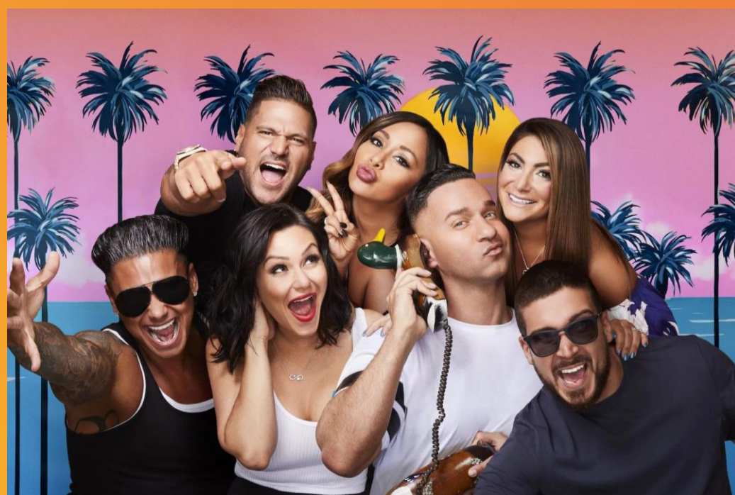
Jersey Shore Family Vacation